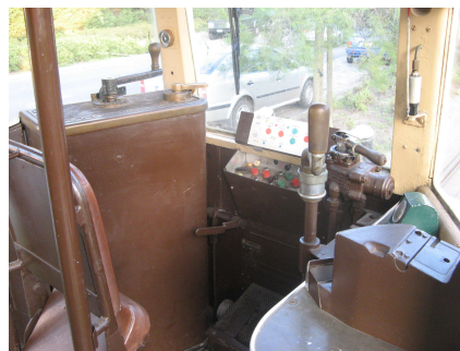
Motrice SE 9093

Année de construction: 1957 Places assises: 33